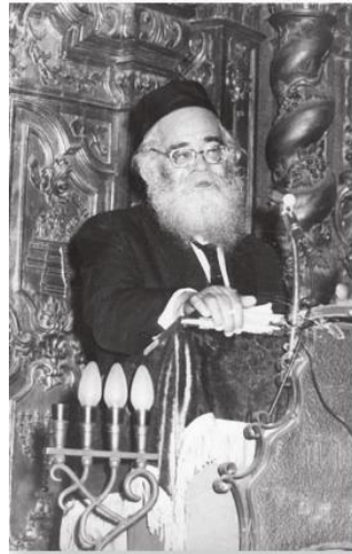
רבי אלעזר מנחם מן שך

He became entranced, staring at the picture and praising R' Shach Zatzal with utmost awe and reverence. This