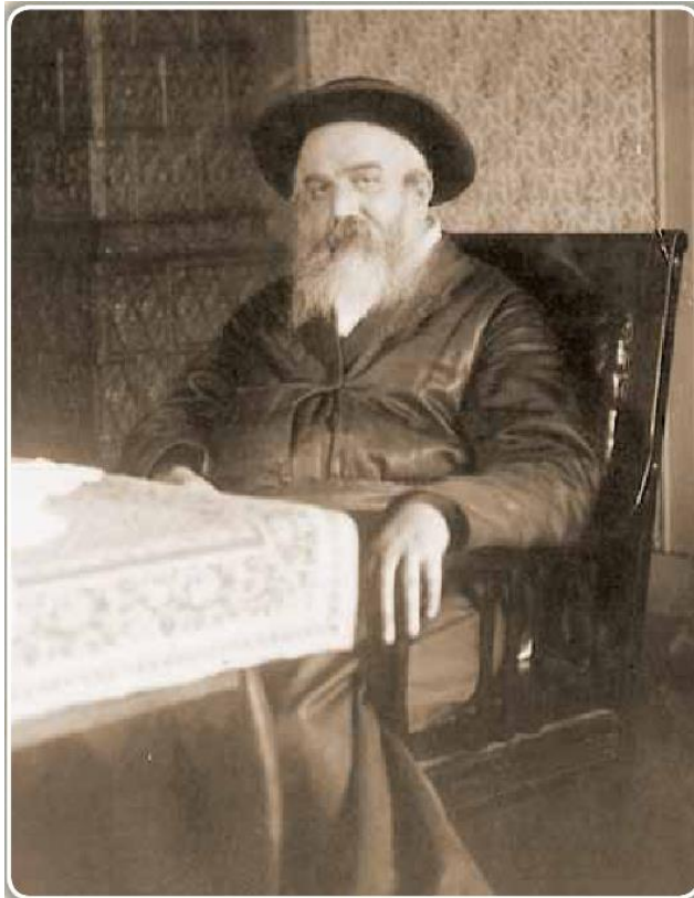
R' Chaim Elozor Shapiro of Munkatch, author of Minchas Elozor

Despite being known for his fierce Kana'us , the Minchas Elozor was a tremendous: בעל בכי (prone to cry), and the Mashgiach R' Nosson Wachtfogel Zatzal once said that crying is the language of the heart. After hearing a fiery Shmuess from R' Elya Lopian Zatzal , the Alter of Slabodka Zatzal asked a Talmid if he cried. He exclaimed that anyone who didn't cry, deserves to be kicked out of the Yeshiva . **** Tears are precious, and the gates of tears are never closed; you can be: פועל ישועות גדולות how Yosef HaTzaddik cried and cried! (Just