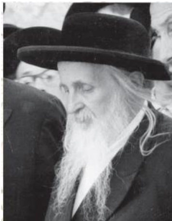
R' Yoel Teitelbaum of Satmar