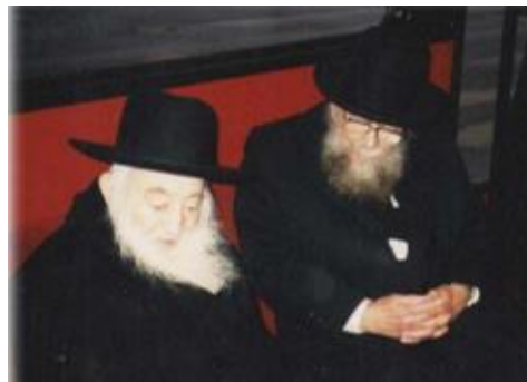
R' Nosson Wachtfogel (left) with R' Shlomo Wolbe (right)

Many years ago, I had just finished davening, and a Yungerman came over to me to tell me that he took my advice; he decided to believe in himself, and be M'zakeh the Rabim with his Torah . He is a big Talmid Chochom , who is "top-top" in learning.