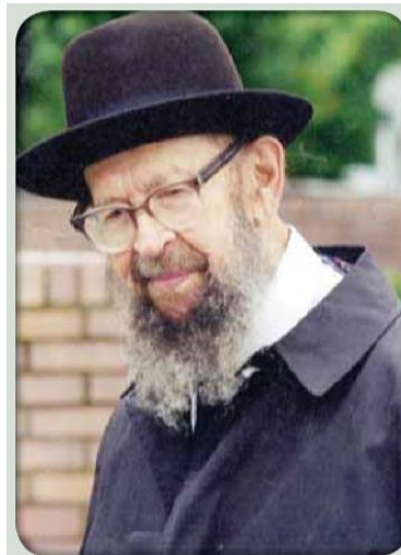
R' Avigdor Miller

that Hashem doesn't expect the average person to conquer all his weaknesses, like R' Avigdor Miller Zatzal or Novardokers did. *****