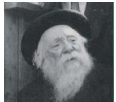
The Kapitchnitzer Rebbe

A person I know, was close to the Kapitchnitzer Rebbe . He observed that the Rebbe