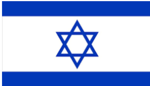
The Star of Israel.