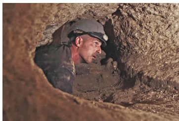
Bar Kochba Revolt era hiding complex revealed near Sea of Galilee

.The area is mentioned in the Book of Joshua (Joshua 19:34) and has been settled since ancient times