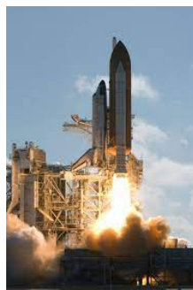
"We Have Liftoff"