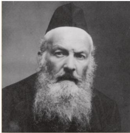
R' Elchonon Wassermann

(And there were very few people whose hand he would shake). This Adam Gadol was once told about a big artist whose pictures were very real. The artist drew a picture of Yetzias Mitzrayim , and the Gadol didn't like the picture. He noticed that the noses of the Mitzri'im and the Jews were similar, and his father had told him that they are different. ***