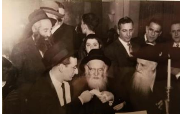
R' Ahron Kotler (center) and R' Avrohom Kalmanovich (right) at a Chasuna. Standing (left) is the Mashgiach, R' Nosson Wachtfogel

although they were Chashuvim , they still didn't get involved in helping the Tzibbur . The Alter of Novardok Zatzal said 6 that the main Achrayus to do Zikkui HaRabbim for Klal Yisroel is on the Bnei Torah . Who were seen riding in a car on Shabbos during the Holocaust to save Yidden ? The two Roshei Yeshiva of the biggest