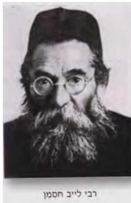
רבי לייב חסמן

R' Nosson Tzvi Finkel, the Alter of Slabodka