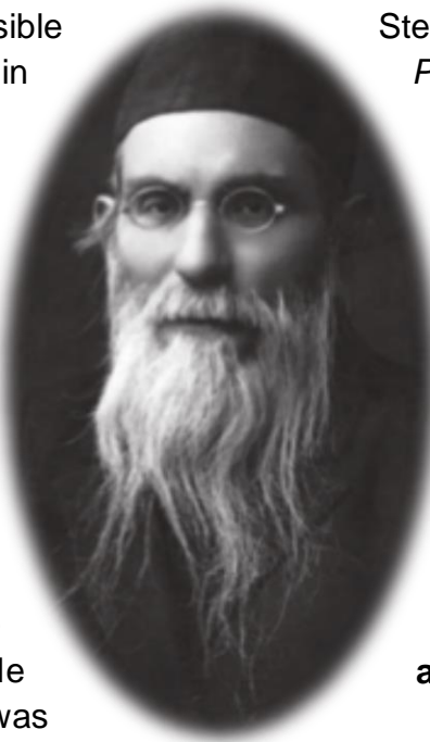
The Alter of Slabodka R' Nosson Tzvi Finkel

"injecting bitter medicine into his Talmidim " wasn't Matzliach . He was a major Baal Mussar , and he criticized himself mercilessly (this is not for us!!) If he felt that he had the slightest ill feeling towards a Talmid , for example, if the Talmid was a drop chutzpadik, then he refused to apply any