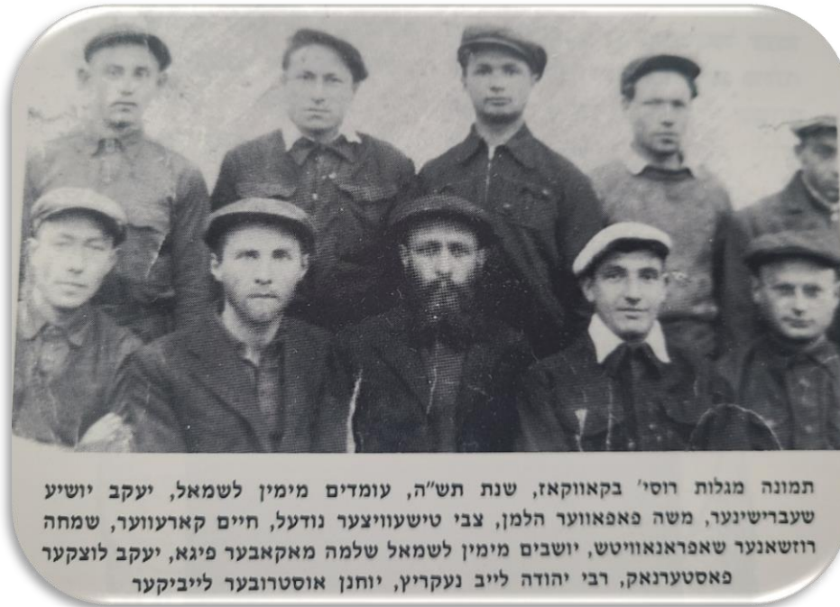
A group of Novardokers who survived Siberia

His son, who was very popular and a true Adam Gadol , told me that he found in his father's: (טַשְׁקֶאווע) notes beautiful Divrei Torah ; but to the public he would only say simple, plain Divrei Torah . Someone once told me that if you tried to "milk" him for some special Yesodos in Avodas Hashem ,