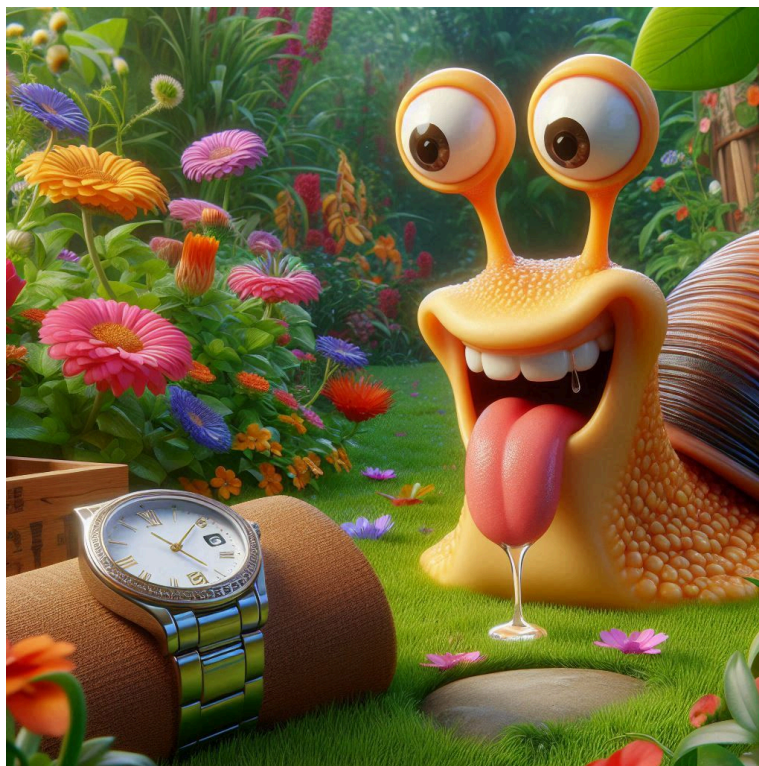
Una babosa babeante

שתיים באילן ואחת בידי אדם או שתיים בידי אדם ואחת באילן כשרה ואין עולין לה ביום טוב שלש בידי אדם ואחת באילן כשרה ועולין לה בי"ט זה הכלל כל שינטל האילן ויכולה לעמוד בפני עצמה כשרה ועולין לה ביום טוב (סוכה כב:-כג.).