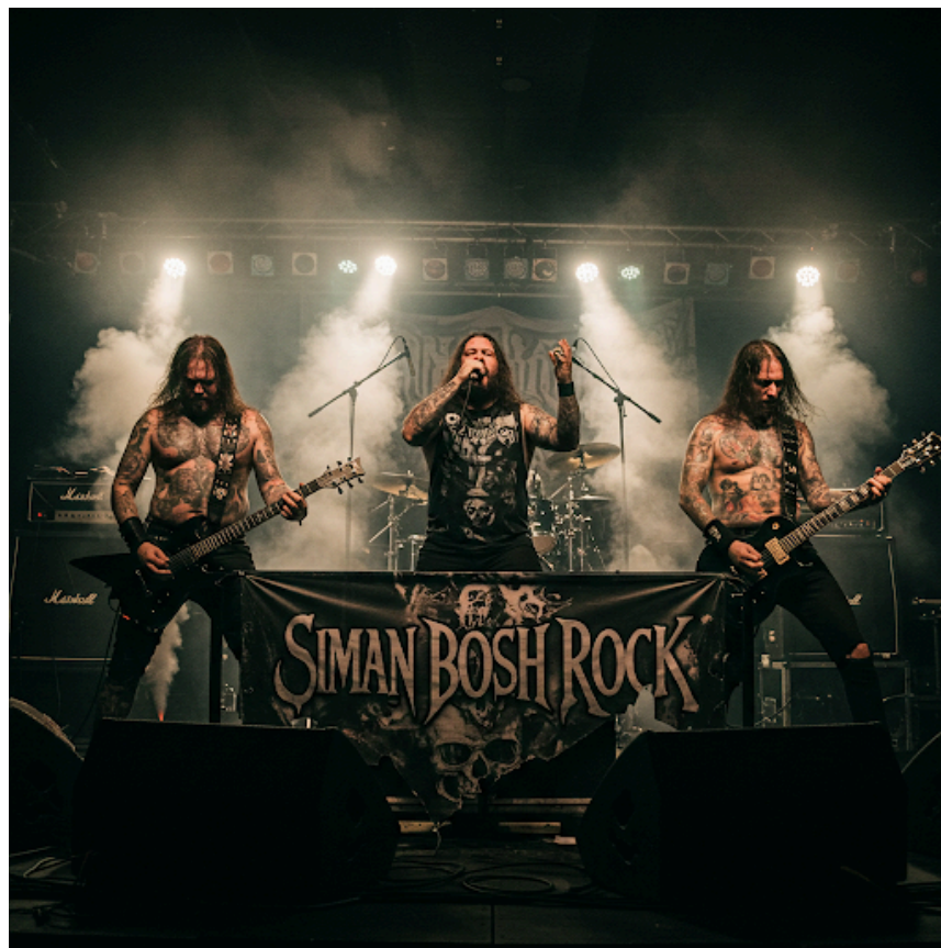
מתנני' רוצה שנתערב באחרים וכו'. גמ' מאן אחרים וכו'. סימן בשר"ק