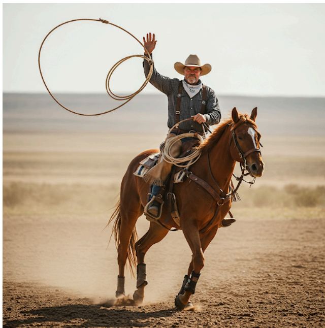
The Holy CowBoy

לכן אמר הנביא נותן לו את בריתי ... (סנהדרין פב:)