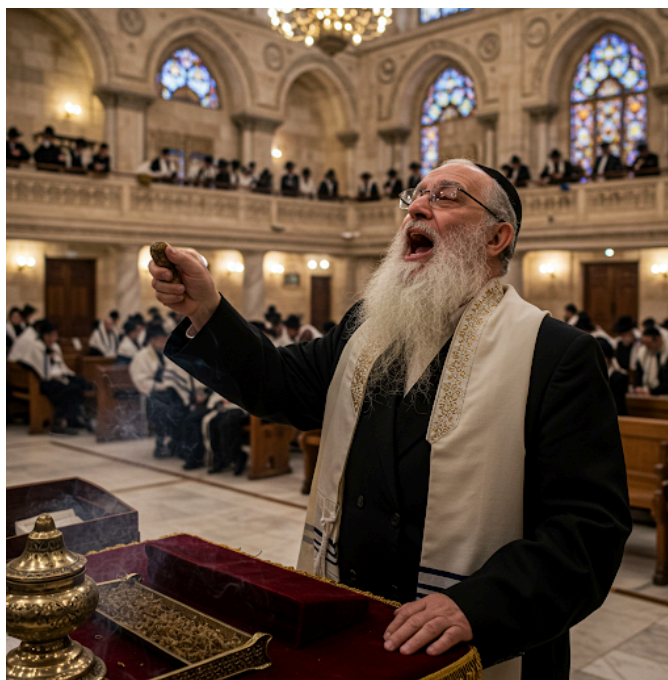
קול יפה לבשמים וכו'. (ירושלמי יומא ד:ה)

ברוריה אשכחתייה לההוא תלמידא דהוה קא גריס בלחישא בטשה ביה אמרה ליה לא כך כתוב ערוכה בכל ושמורה אם ערוכה ברמ"ח אברים שלך משתמרת ואם לאו אינה משתמרת (עירובין נג:גד).